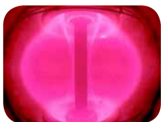
Un plasma dans un tokamak

Pour le faire fusionner, le plasma sera chauffé à de très grandes températures. Pour y parvenir ITER produira de très forts champs magnétiques qui confineront le plasma et ainsi l'éloignera des parois d'un Tokamak.