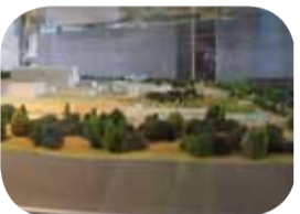
La maquette de site d'ITER

Il faudra près de 10 ans pour construire ITER. Les travaux qui ont commencé début 2007 sont imposants. Ici, il s'agit de construire 39 bâtiments et installations techniques. Sur la plateforme de 40 ha qui peut supporter une charge jusqu'à 25 tonnes au m 2 , le premier d'entre eux s'élève à une vingtaine de mètres de hauteur. Dans ce bâtiment qui sera terminé en 2012, des équipes s'occuperont de la réalisation des anneaux qui formeront des aimants pour maintenir le plasma en lévitation au cœur du tokamak.