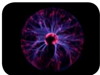
Boule à plasma