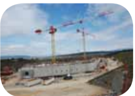
La construction du siège d'ITER